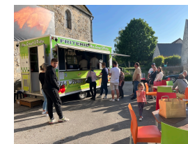
Une bonne partie des produits sont locaux et vendus à petit prix. Les mardi et vendredi, des food trucks proposent leurs spécialités, pizzas et plats cuisinés.