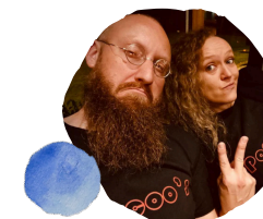
La salle est sonorisée pour bien accueillir les artistes. Selon les projets, les artistes peuvent être en résidence.