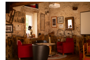
Des espaces intérieur et extérieur soignés et cosy.

L'épicerie propose une palette de produits de base et des produits locaux comme des pâtés, des plats cuisinés, du miel, des confitures, des tisanes, des chips et autres préparations saisonnières. Une offre de restauration variée est accessible depuis le Café citoyen : deux food trucks (pizza et friterie) prennent leur quartier le mardi et le vendredi soir, complétés par les « Grillades lusitaines » 5 jours sur 7. Sans oublier les paniers bio avec l'AMAP à la bonne ferme.